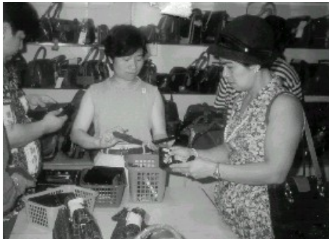
There are a lot of business opportunities out there for those who seek and persevere.

Mahilig ka bang mag-isa o mahilig kang makisalamuha ? Gusto mo bang nag-oopisina o gusto mo bang palabas-labas sa pagbibiyahe ? Kung hilig mong mag-isang magtrabaho, bagay sa iyo ang mga trabahong klerikal. Kung hilig mong palaging may kasama sa trabaho, bagay sa iyo ang mga trabahong kailangan ang teamwork , tulad ng pagiging dancer ng isang dance troupe , o singer sa isang choir o banda, halimbawa. Kung mahilig kang magbiyahe, bagay sa iyo ang maging ahente, tourist guide , flight steward , piloto, driver , konduktor; o area manager , halimbawa.