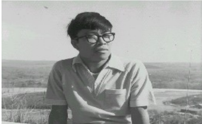
Mangarap ka . . . at magsikap. Sabi ng isang awitin, “Magsikap ka . . . simulan mo.”

Kung ikaw ay nasa high school , graduating o katatapos lamang ng high school , tanungin mo ang iyong sarili. Ano ba ang gusto mong mangyari sa buhay mo. Ano ba ang gusto mong maging trabaho o propesyon? Ano ba ang magiging kalagayang mo pagkalipas ng mga taon? Limang taon, sampung taon? Ano ba ang gusto mong maging estado mo sa buhay pagtanda mo? At paano mo mararating ang iyong mga pangarap?