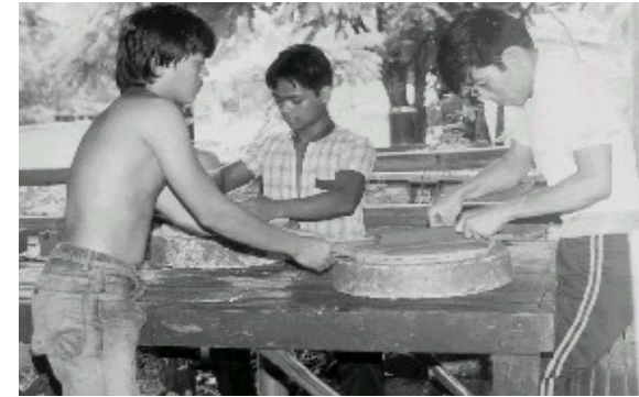
Ceramics activity. These men are molding clay into decorative items.

paniniwala niya ay ayon sa kanyang nakikita, at hindi sa bagay na teoretikal.. Kung may kausap, mas nakukuha niya ang tono ng boses ng kausap, o kung paano magsalita ang kausap, kaysa sa mismong mensahe o sinasabi ng kausap. Walang tiyak na pagkakasunud-sunod ang pagbasa niya sa mga impormasyon, random , wika nga. Mahilig siyang kumumpas ng kamay habang nagsasalita, na wari bang nagbibigay-diin sa sinasabi, o kaya ay magpakita ng saloobin sa pamamagitan ng bikas ng mukha. Mas malakas ang dating sa kanya ng emosyon, kaysa sa dating ng impormasyon. O kung may impormasyon, mas nasasala niya ang damdaming dala ng impormasyon kaysa sa aktuwal na sinasabi ng impormasyon. Hindi siya mabusisi sa oras: mahuli na kung mahuli sa usapan o takdang usapan. Mas naaalala niya ang mukha ng mga tao, kaysa sa kani-kanilang mga pangalan. Malikot siya kapag nag-aaral ng leksyon, at maaari pang makinig sa musika habang nag-aaral. Mas gusto niya ang mga larawan o padron kaysa sa mga salita. May kaugalian pa siya na magtanong sa lohika o kung bakit at ano ng regulasyon o alituntunin. Mas gusto niyang aktuwal na nahahawakan ang mga bagay. Kung minsan ay hindi niya maitakda kung aling gawain ang uunahin, at madalas ay kung ano na lang ang unang dumating. Basta na lamang siya bubuo ng isang bagay, aparato halimbawa, maski hindi pa niya nababasa ang direksyon o tagubilin hinggil sa pagbuo nito.