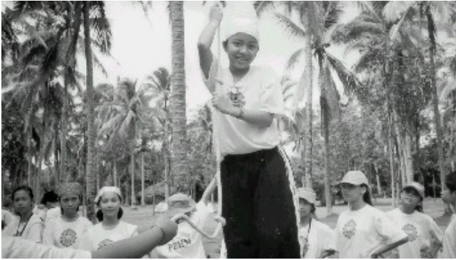
Student group activities help develop their outlook, talents and potentials. Some emerge as leaders.

Ang mga taong mas malakas ang kanilang right brain ay iyong mas nakakabasa ng damdamin o emosyon, sa mga kutob. Sila iyong mga mapanlikha ( creative ), mapangarapin, mapag-imahinasyon. Mahilig sila sa kaayusan ng mga kulay at espasyo at mga impresyon sa isipan. Kaya nilang lumaro sa buhay, o makipagsapalaran. May ugali silang pabugso-bugso ( impulsive ). Sila ay masiste at mahilig din naman sa sports o palakasan. Ang mga trabahong kaugnay dito, halimbawa, ay arkitekto, artista, pintor, eskultor, manunulat, interior designer , at beauty consultant .