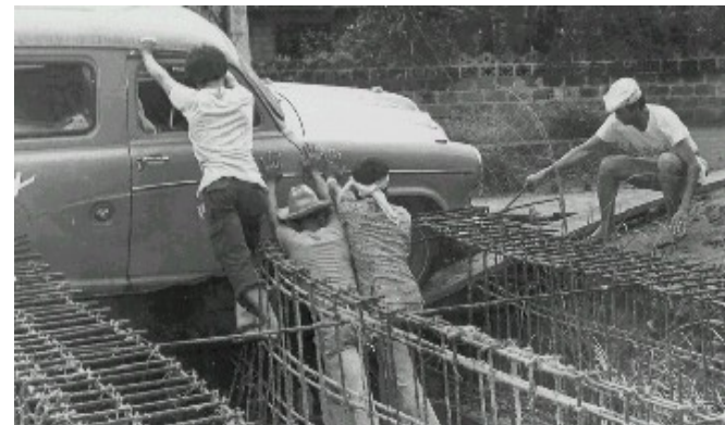
Kung may problema, may solusyon.

pangangalap ng basura. Nang makaipon siya ng puhunan ay siya naman ang kumuha ng mga tauhan upang mamulot ng basura. Sa bandang huli, siya ay nakapagtayo ng junk shop mula sa mga abubot na napupulot sa basura. Hindi lang iyon: mayroon na siyang dump trucks na pangontrata niya sa pangongolekta ng basura. Sa katawagan, siya ay basuro-ro, pero sa kita, nakangiti siyang nagsasabing “May pera sa basura.”